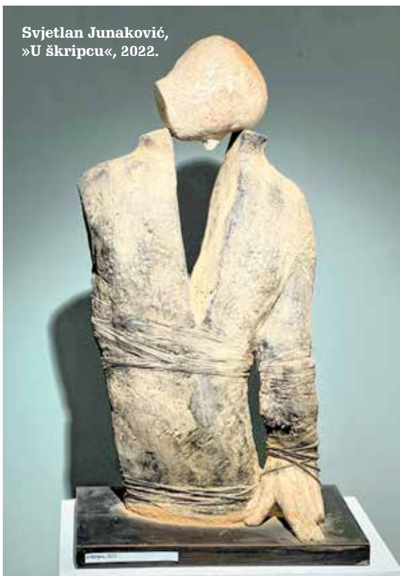
Svjetlan Junaković, »U škripcu«, 2022.

Društvo povjesničara umjetnosti Rijeke kroz program »Revitalizacije likovne kritike« u suradnji s Katedrom za modernu i suvremenu umjetnost Odsjeka za povijest umjetnosti Filozofskog fakulteta u Rijeci i Novim listom, potiče objavljivanje studentskih radova, prikaza i kritika recentnih izložaba, nastalih u okviru rada na kolegiju »Medijacija i kritika«.